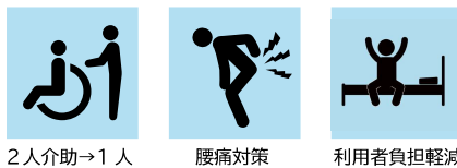
2人介助→1人 腰痛対策 利用者負担軽減