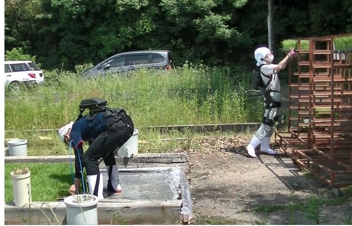
稲の苗出し作業にて検証 (被験者：愛知県農業総合試験場 職員)